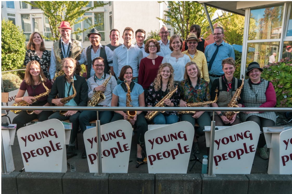
Aktuelles Gruppenfoto der Band.